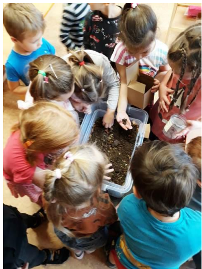
Pierakstīja Agita